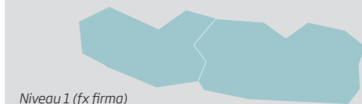
Niveau 1 (fx firma)