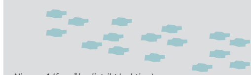
Niveau 4 (fx målerdistrikt/sektion)