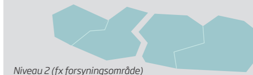
Niveau 2 (fx forsyningsområde)