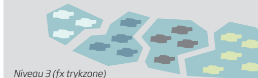
Niveau 3 (fx trykzone)